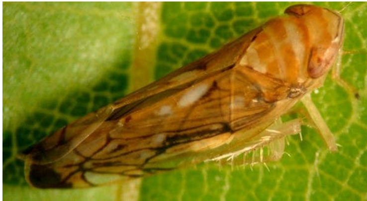
Slika 1. Odrasli oblik američkog cvrčka