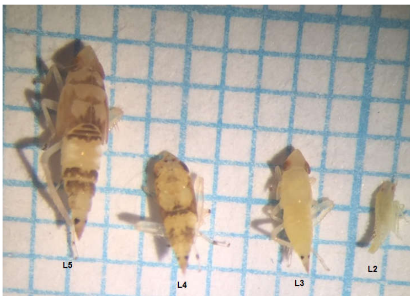
Slika 1. Razvojni stadiji ličinki