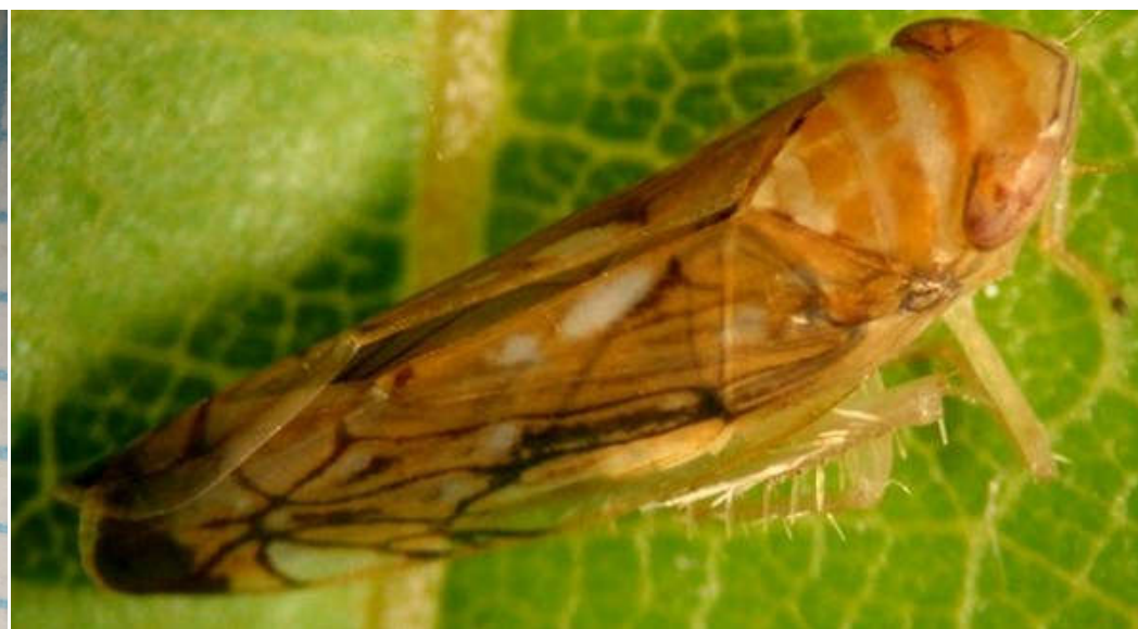
Slika 2. Odrasli oblik američkog cvrčka